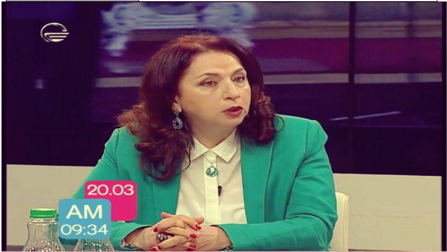
საგრანტო პროექტებში მონაწილეობა ბოლო 5 წლის განმავლობაში